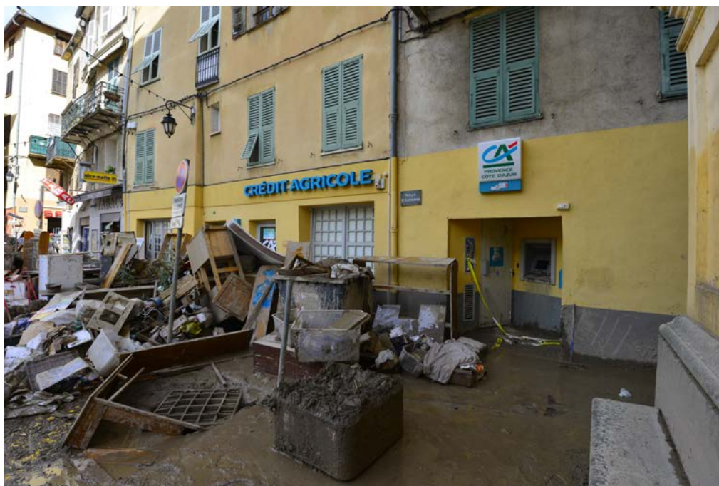
Breil-sur-Roya, France, le 10 octobre 2020, dégâts de la tempête Alex

Tous les ans, des milliers de Français doivent évacuer leur domicile.