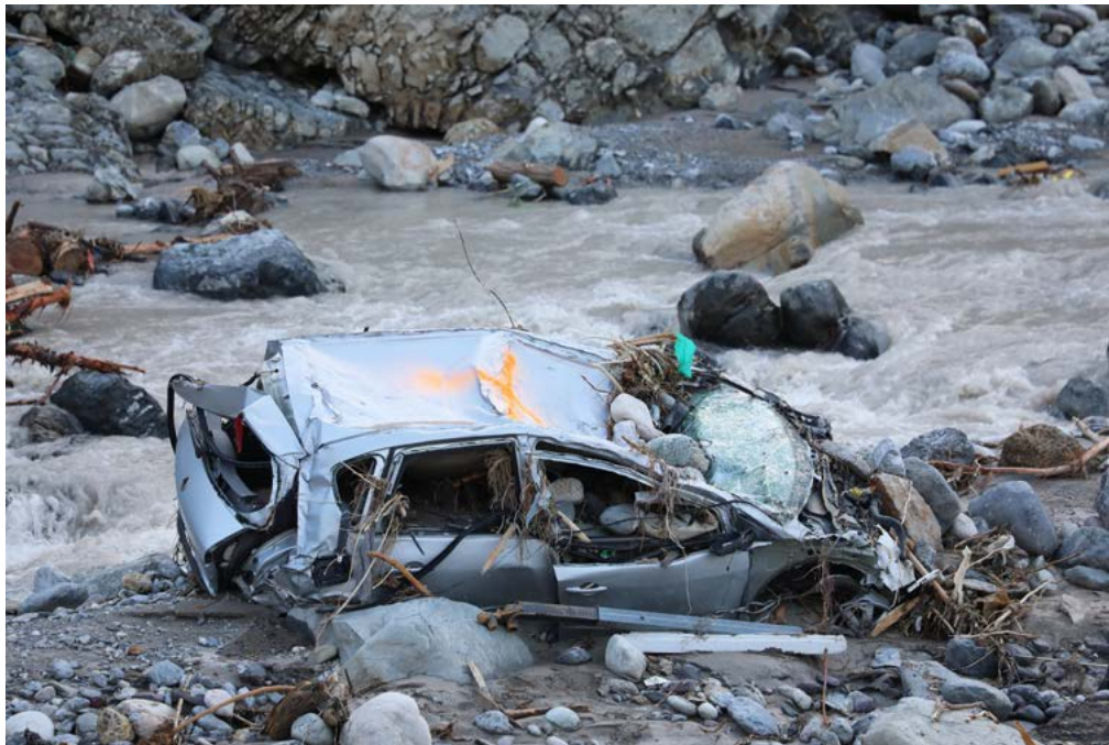
Breil-sur-Roya, France, le 8 octobre 2020