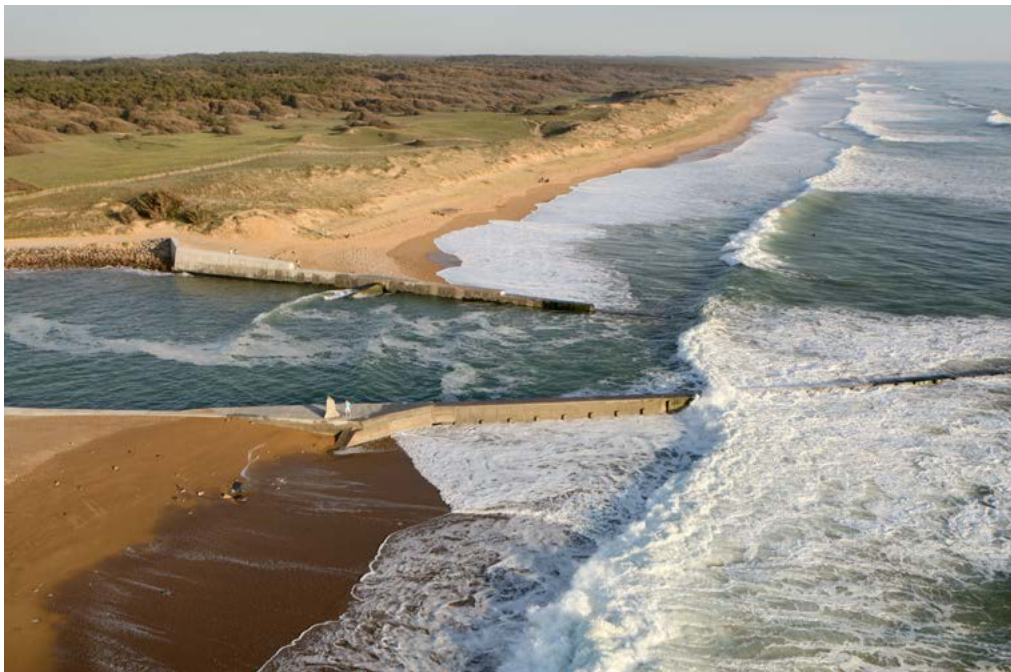
Barrage de la Gachère, entre Brétignolles-sur-Mer et Olonne-sur-Mer, situé à l'ouest de la Vendée, France.

Mais ils sont incapables de prévoir les répercussions sur terre d'une surcote. 3